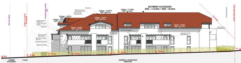
Façade Ouest sur rue