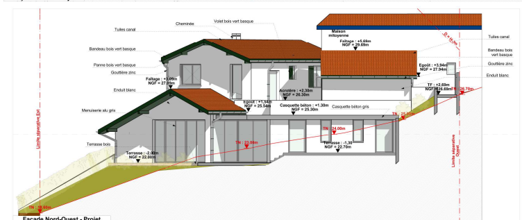
Façade Nord-Ouest - Projet