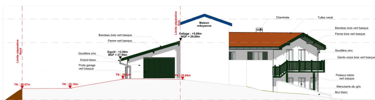
Façade Ouest - Projet

Les deux volumes existants séparés par le jardin seront reliés en respectant le dénivelé du terrain, donnant une impression d'une seule et unique villa de type basque.