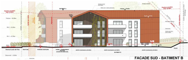
FAÇADE SUD - BÂTIMENT B

Les espaces verts sont en majeure partie distribués en jardins privatifs plantés d'arbres et engazonnés.