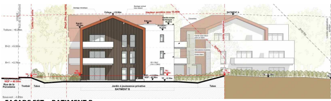
FAÇADE EST - BÂTIMENT B