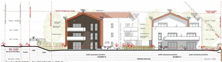
FAÇADE EST - BÂTIMENT A ET B