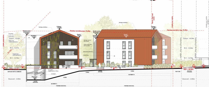
FAÇADE OUEST - BÂTIMENT A ET B