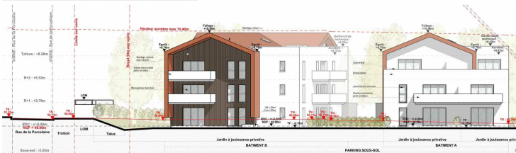
FAÇADE EST - BÂTIMENT A ET B