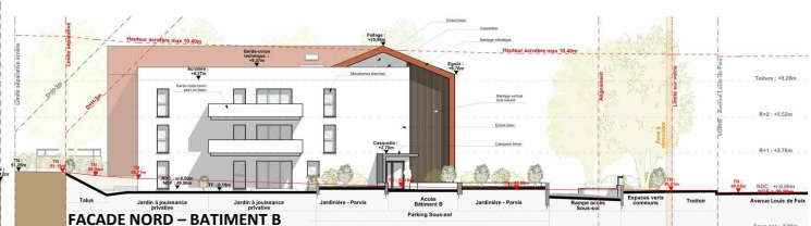
FAÇADE NORD - BÂTIMENT B